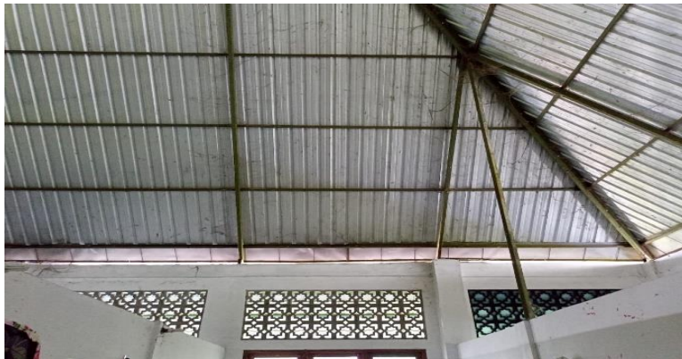
Gambar 2. Atap sebelum dilakukan pemasangan plafon

Proses pemasangan plafon merupakan kegiatan inti yang dilakukan dengan tujuan untuk mengendalikan jumlah serangan kumbang paedae. Kegiatan ini dilakukan oleh pelaksana dengan bekerjasama bersama tenaga professional (tukang). Berikut adalah gambaran atap sebelum dan sesudah dilakukan pemasangan plafon.