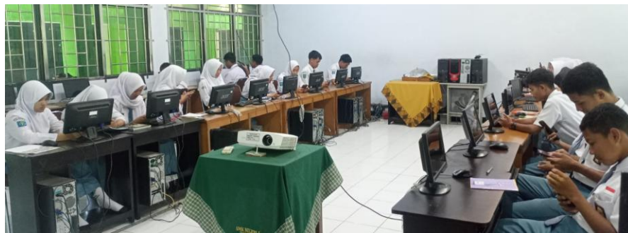
Gambar 1 Dokumentasi Pretest

Kegiatan pengabdian dilakukan di salah satu SMK di Wilayah Temanggung diawali dengan persiapan berkoordinasi dengan pihak sekolah. Kegiatan penyuluhan dilaksanakan pada tanggal 20 Februari 2024 di kelas XI ATP 1 dengan jumlah 29 siswa. Kegiatan diawali dengan pretest dengan menanyakan beberapa pertanyaan tentang stunting dan pentingnya makanan bergizi. Hasil dari pretest didapatkan 90% siswa tidak tahu tentang stunting. Berikut dokumentasi hasil kegiatan pretest :