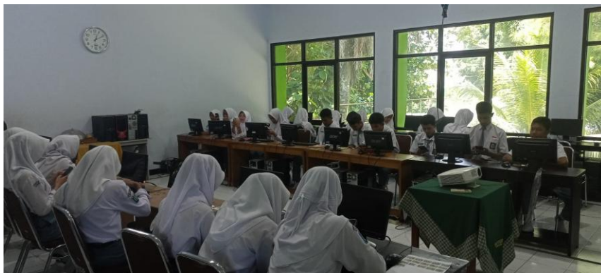
Gambar 3 Dokumentasi Posttest

Setelah selesai pemberian materi dalam kegiatan ini dilakukan evaluasi dengan melakukan posttest dengan menanyakan tentang stunting dan pentingnya makanan bergizi, didapatkan hasil 100% siswa dapat menjawab dengan benar. Berikut dokumentasi hasil kegiatan pengabdian yang dilakukan :