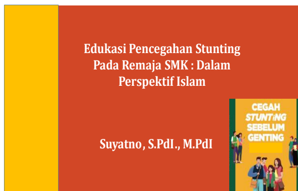
Gambar 2 Tema Edukasi

Kemudian kegiatan dilanjutkan dengan penyuluhan kurang lebih 50 menit. Materi penyuluhan berisi tentang definisi, ciri anak stunting, gejala stunting, pencegahan stunting dan pencegahan stunting dalam perspektif Islam. Berikut slide materi edukasi :