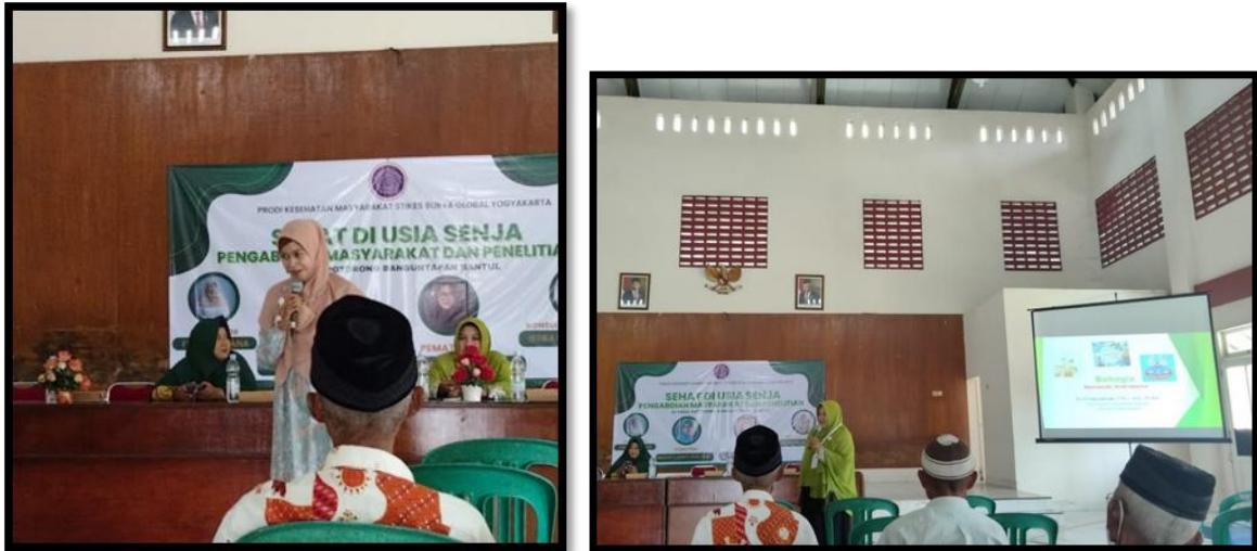
Gambar 1. Penjelasan materi

Pada gambar diatas menunjukkan kegiatan penjelasan materi materi tentang andropouse, yang kemudian dilanjutkan dengan sesi tanya jawab oleh para peserta.