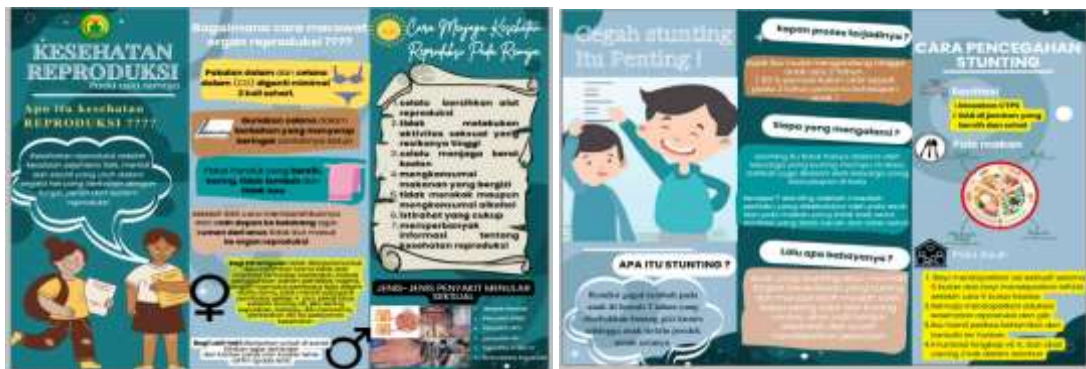
Gambar 2. Leaflet kesehatan reproduksi dan pencegahan stunting

Media penyuluhan kesehatan dengan PPT dan leaflet di percaya akan meningkatkan pengetahuan lebih baik dibandingkan pemberian informasi tanpa menggunakan media. Informasi yang diberikan secara visual maupun audio visual akan mempermudah untuk proses mengingat. Hal ini sesuai dengan penelitian terdahulu tentang efektivitas penyuluhan kesehatan reproduksi remaja dengan pemberian modul terhadap perubahan pengetahuan remaja. Dalam penelitian tersebut menyatakan bahwa penyuluhan kesehatan efektif dengan media yang tepat memengaruhi terhadap perubahan pengetahuan remaja. (Asda 2021)