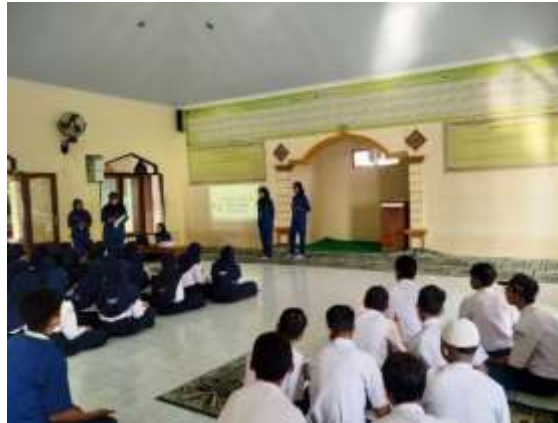
Gambar 1. Kegiatan penyuluhan

Media penyuluhan kesehatan dengan PPT dan leaflet di percaya akan meningkatkan pengetahuan lebih baik dibandingkan pemberian informasi tanpa menggunakan media. Informasi yang diberikan secara visual maupun audio visual akan mempermudah untuk proses mengingat. Hal ini sesuai dengan penelitian terdahulu tentang efektivitas penyuluhan kesehatan reproduksi remaja dengan pemberian modul terhadap perubahan pengetahuan remaja. Dalam penelitian tersebut menyatakan bahwa penyuluhan kesehatan efektif dengan media yang tepat memengaruhi terhadap perubahan pengetahuan remaja. (Asda 2021)