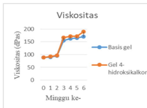
Gambar 2. Hasil viskositas selama penyimpanan

Hasil pH basis dan gel 4-hidroksikalkon selama enam minggu penyimpanan ditunjukkan pada gambar 1. Selama enam minggu penyimpanan, basis dan gel 4-hidroksikalkon stabil dan memiliki nilai pH sekitar 6,4-6,6. pH gel percobaan sesuai dengan pH kulit manusia.